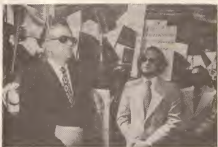
Ministro pa asuntonan antlyano, Sr. A. v.d. Stee, dilanti un demonstracion di simpatia na su jegada na oficina di Gobierno Insular (April 1978).